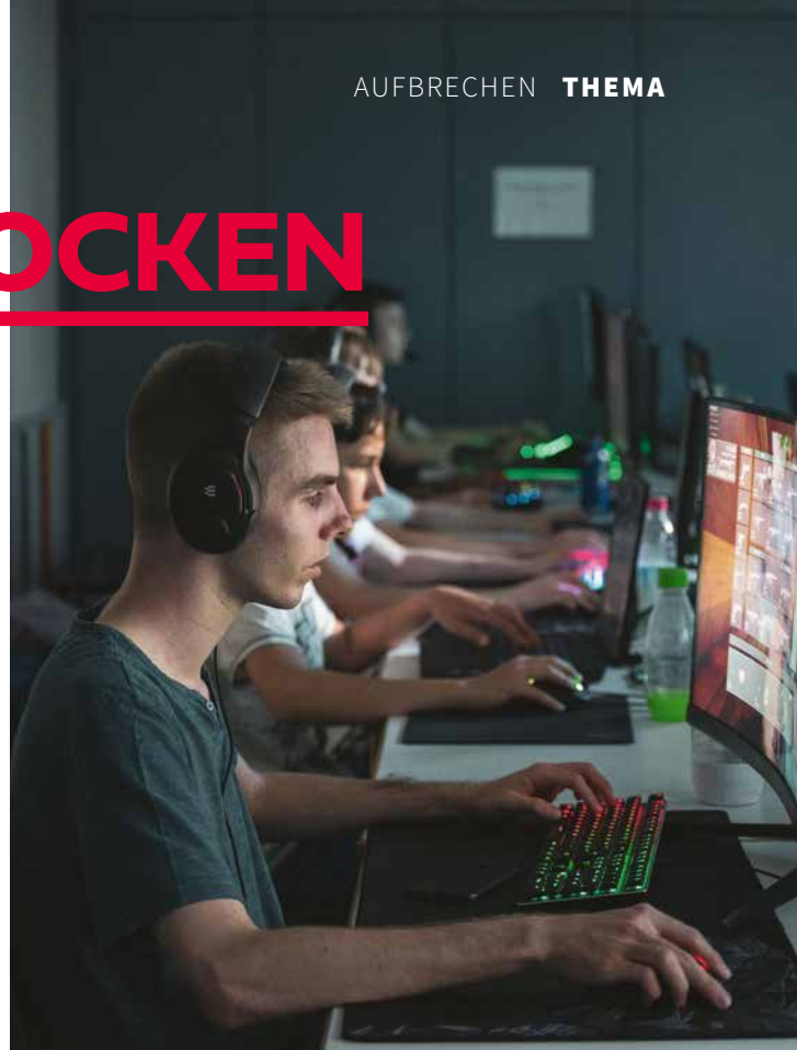
Eindrücke des E-Sport-Camps im CVJM München

Eine Woche lang verbrachte eine Gruppe jugendlicher Gamer unter professioneller Anleitung eine Freizeit im Haus des CVJM München, teilte Leben, Essen und Gemeinschaft und zockte miteinander. Ziel dabei war klar, die Fähigkeiten der Jugendlichen in den Spielen zu fordern und zu fördern,