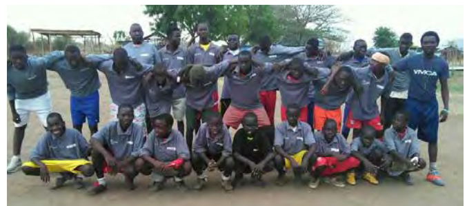
Das Sportteam des YMCA im Südsudan

Kriege und gewalttätige Konflikte prägen Staaten und das Zusammenleben von Menschen. Menschen erleben Ungerechtigkeit, und das Miteinander ist eher von Misstrauen geprägt als durch ein friedvolles und versöhnliches Miteinander. Mit dem Programm »Misión Paz« (Mission Frieden) will der YMCA Kolumbien junge Menschen dazu befähigen, sich für ein friedliches Miteinander einzusetzen. Zu diesem Programm gehört bewusst auch der Aufbau von geistlichen Gemeinschaften. In Sportangeboten bietet der YMCA Südsudan jungen Menschen Räume, um sich auszuzeichnen. Im Sport lernen sie, Emotionen und Kräfte zu kontrollieren sowie fair miteinander umzugehen. Menschen unterschiedlicher Bevölkerungsgruppen kommen in diesen Angeboten zusammen, Vertrauen zueinander kann entstehen und wachsen.